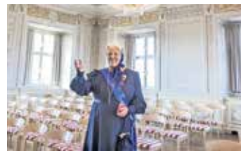
Maximiliana Führung im Goldenen Saal

Klangvolle Prachtorgeln, Barock-Führungen mit Musikeinlagen und Einblicke ins Alltagsleben des 18. Jahrhunderts sind nur ein paar der Zutaten für die BAROCKwoche 2020. Vom 8. bis 16. August entführen 18 Stationen entlang der Oberschwäbischen Barockstraße in die sinnesfrohe Epoche.