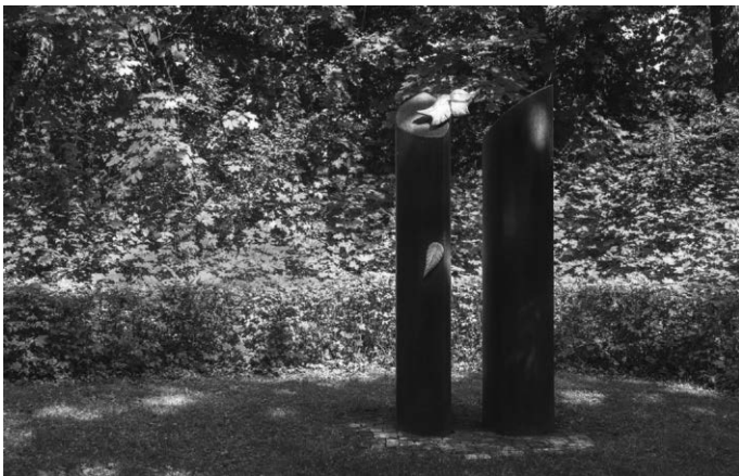
Am 16. Oktober findet die nächste Trauerfeier für Sternenkinder auf dem Biberacher Stadtfriedhof statt.