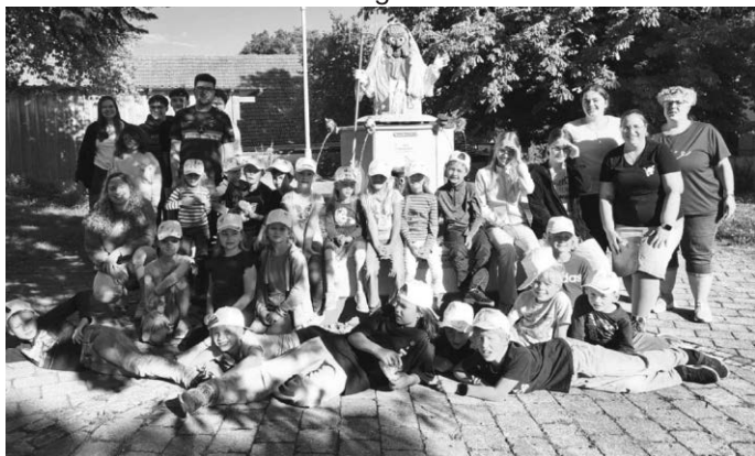
Gruppenfoto Kinderferienprogramm bei den Moorochsen

Am diesjährigen Kinderferienprogramm der Stadt Bad Buchau hat sich auch wieder die Narrenzunft Moorochs beteiligt. Die Moorochsen sind hier seit vielen Jahren ein fester Bestandteil. 22 Kinder kamen zum Zunftheim der Moorochsen und freuten sich dort auf einen spannenden Nachmittag mit verschiedenen Spielen, Bastelaktionen und Experimenten. Einem abwechslungsreichen Nachmittag beim Zunftheim und auf dem Pausenplatz des Progymnasiums auf dem Le-Lion-d'Angers-Platz stand also nichts mehr im Wege.