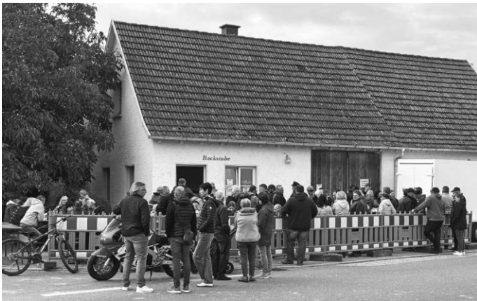
Das Backhaus Allmannsweiler nach langer Pause wieder in Betrieb.

Hohen Zuspruch erhielten unsere Initiatoren zum vergangenen Feierabendhock am Backhaus Allmannsweiler. Der Ansturm auf die leckeren Dinnete war groß und machte Lust auf mehr, so der allgemeine Tenor der Anwesenden. Bei super Bewirtung und toller Atmosphäre ging das Treffen weit über den Feierabend hinaus und man darf gespannt sein, ob sich genügend Interessenten zum Fortführen dieser tollen Idee gefunden haben.