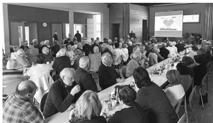
„Volles Haus“ beim Seniorennachmittag in Allmannsweiler.