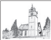
Pfarrei Johannes der Täufer Dürnuu