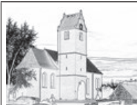
Pfarrei St. Clemens Betzenweiler