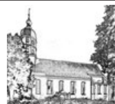
Pfarrei Mariä Himmelfahrt Seekirch

Der Erlös kommt einem sozialen Projekt zugute, das die Erstkommunionkinder festgelegt haben.